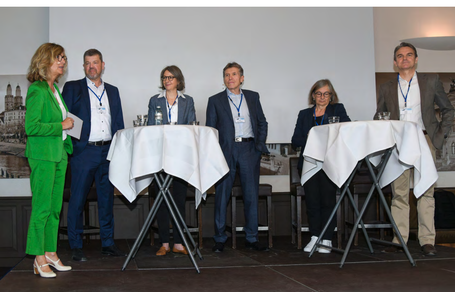
Networking in den Pausen, Referate sowie Meinungs austausch am Podium während den 17. Zürcher Gesundheitstagen.

und damit die wirtschaftliche Leistungsfähigkeit einer Volkswirtschaft, die Gesundheitswirtschaft ausserdem eine Branche in unserem Wirtschaftssystem ist, die Menschen beschäftigt und Zulieferer benötigt.